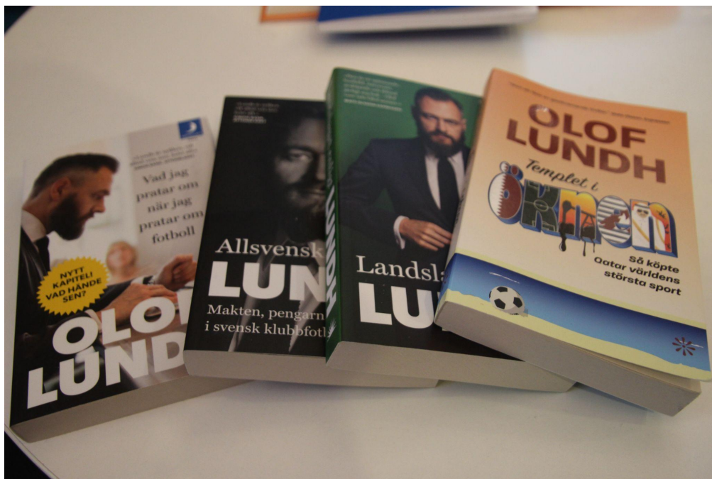
Böcker till försäljning, vilka hade strykande åtgång efter mötet.

riktigt rädd eftersom några norska journalister tidigare blivit anhållna då de vistats på förbjudet område.