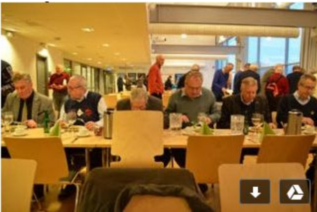
Salen håller på att fyllas och maten ser ut att smaka bra.